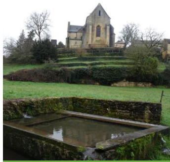
Fontaine de la Canal